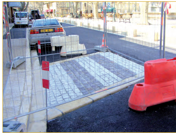
Création du passage clouté