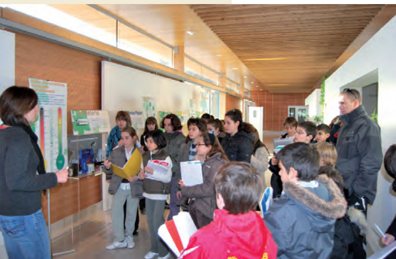
Visite de la classe des cm2 (groupe scolaire c. piquet) Exposition sur les déchets