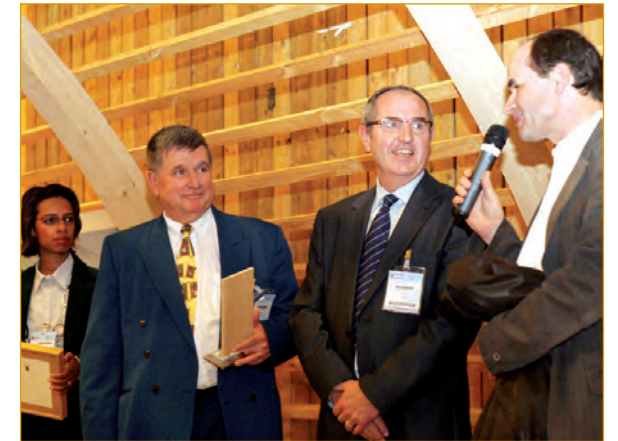
Remise du 1 er prix de la construction publique bois