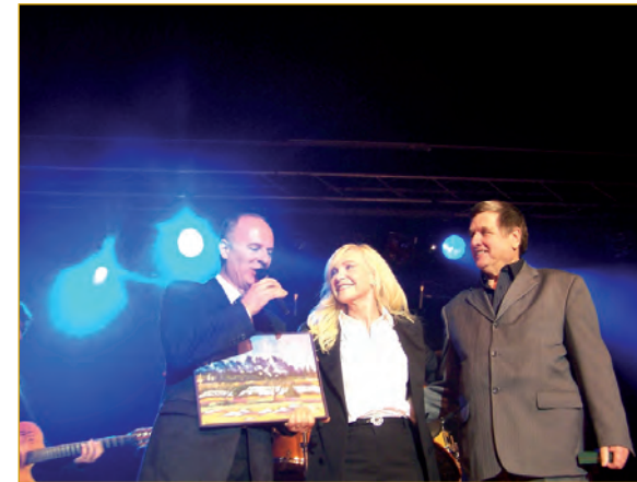
Concert de Michel TORR