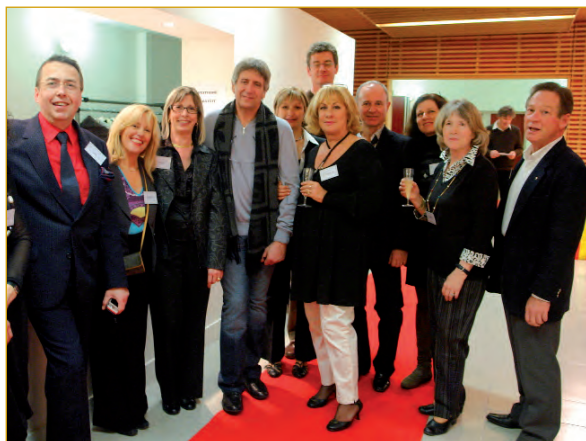
Yves Duteil entouré d'admirateurs