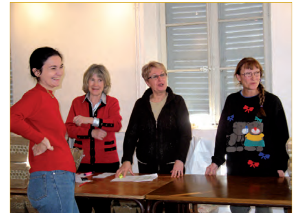
Distribution des colis de Noël 2008