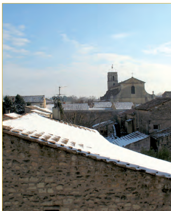
7 janvier 2009