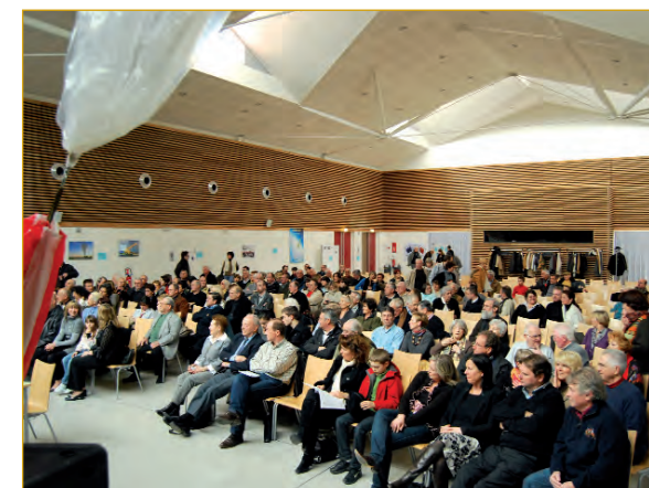
Public venu assister à la conférence de Michel Fournier