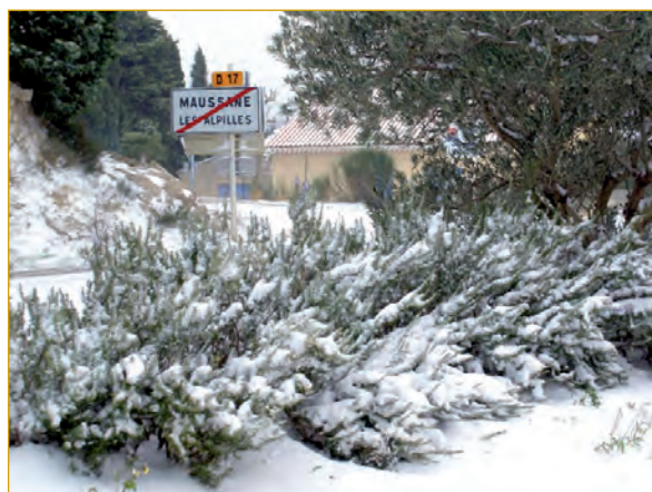
7 janvier 2009