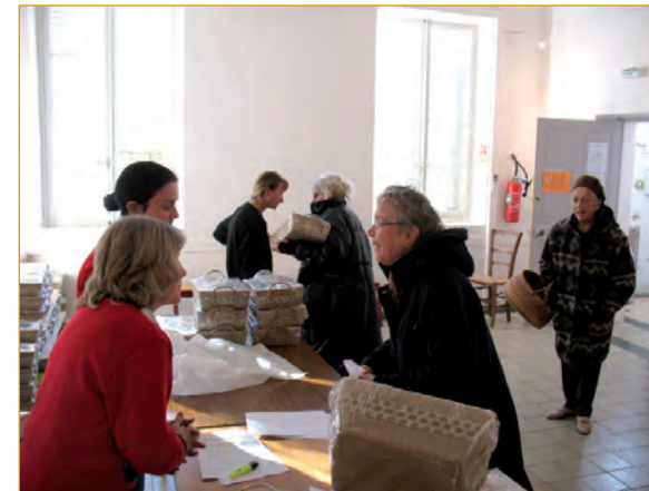
Distribution des colis de Noël 2008