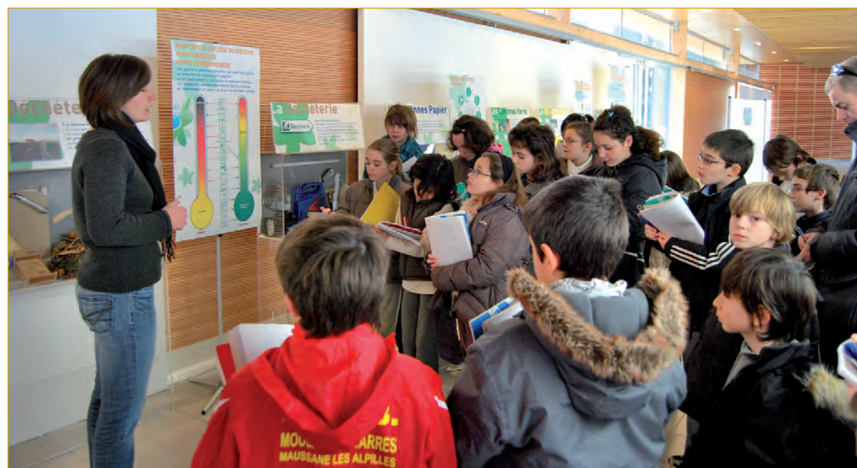
Visite guidée des CM2 lors de l'exposition sur les déchets