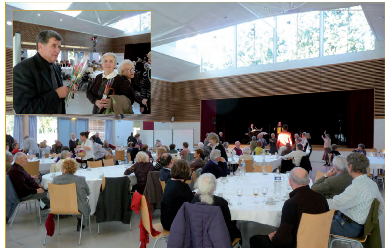
Noël des anciens