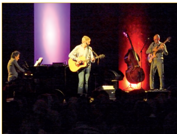
Yves Duteil en concert à la salle Agora