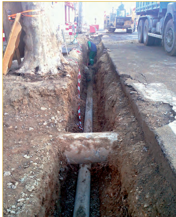
Réseau, avenue de la Vallée des Baux