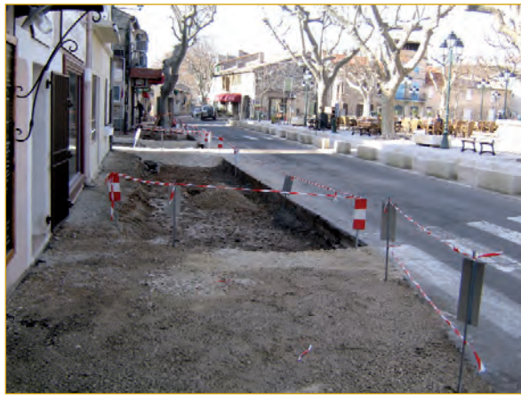
Création d'un trottoir