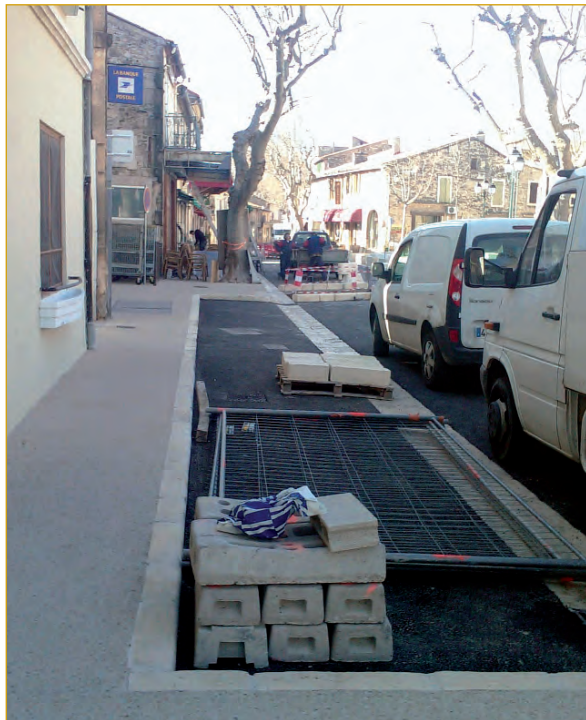
Finition des trottoirs