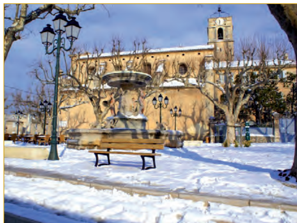
7 janvier 2009