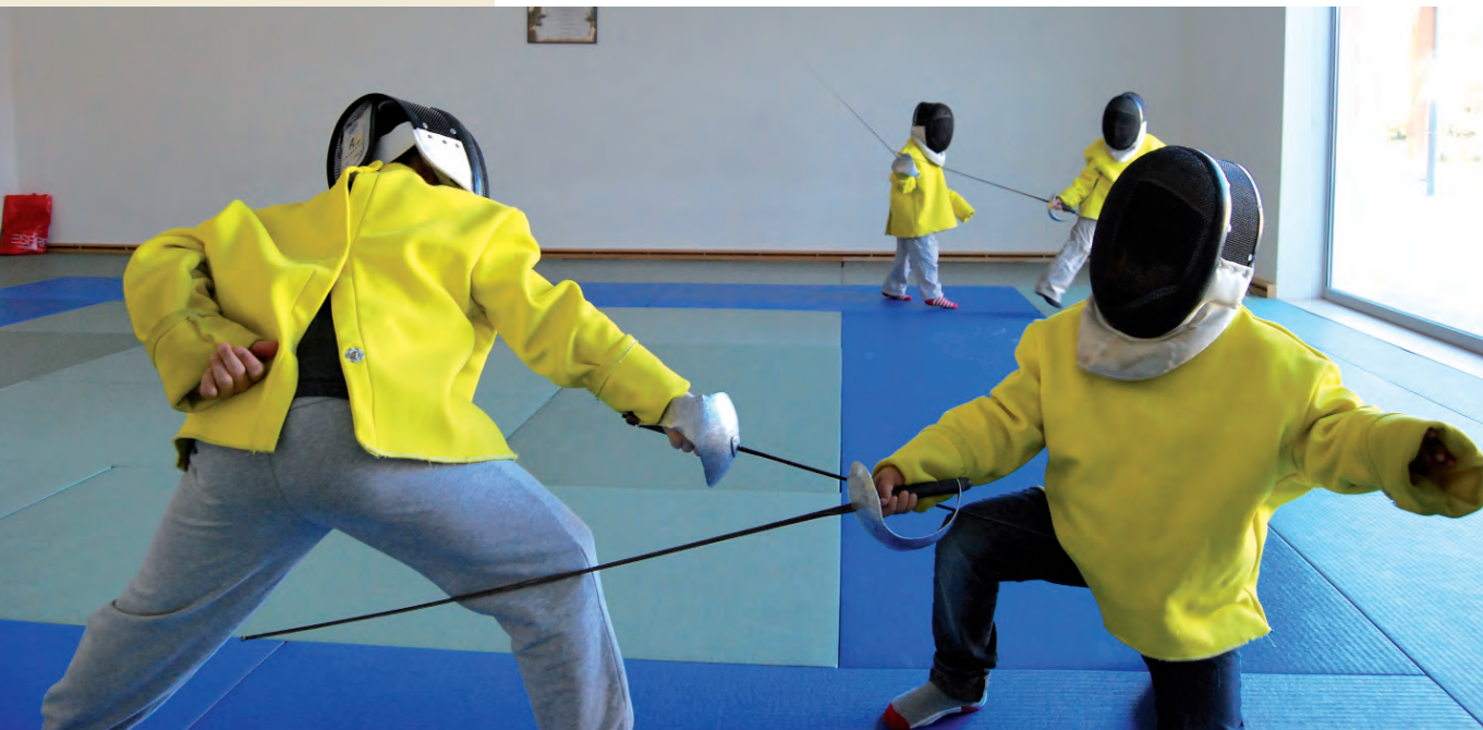
Stages sportifs vacances de février : initiation à l'escrime