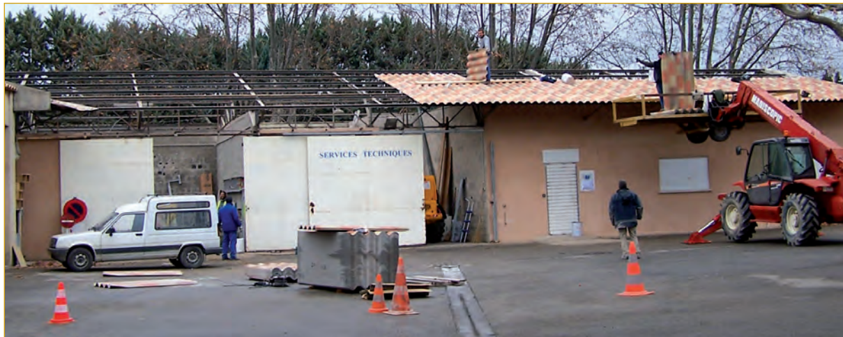
Réfection toiture marché couvert et services techniques