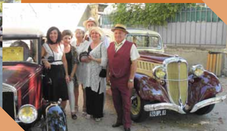
Temps Retrouvé, voitures d'antan