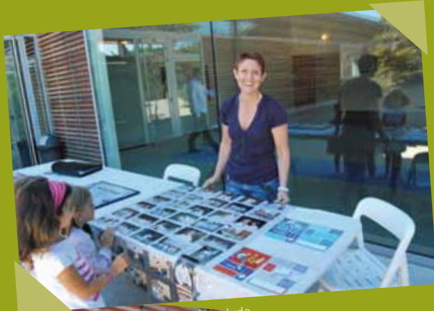
Forum des associations - septembre - Judo