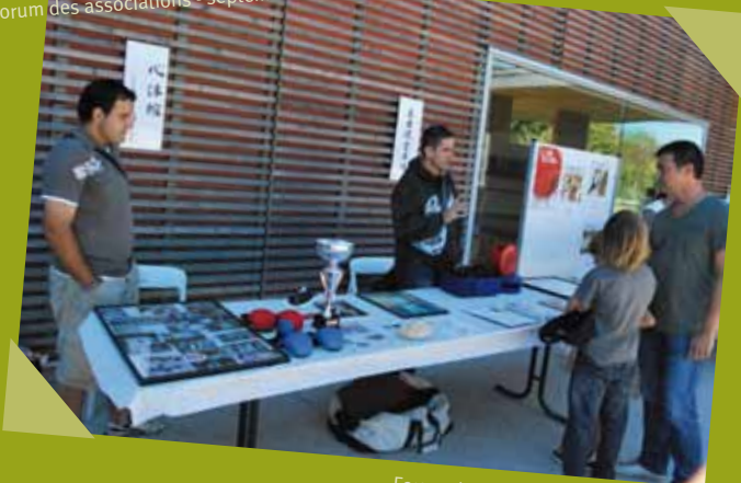
Forum des associations - septembre Karaté