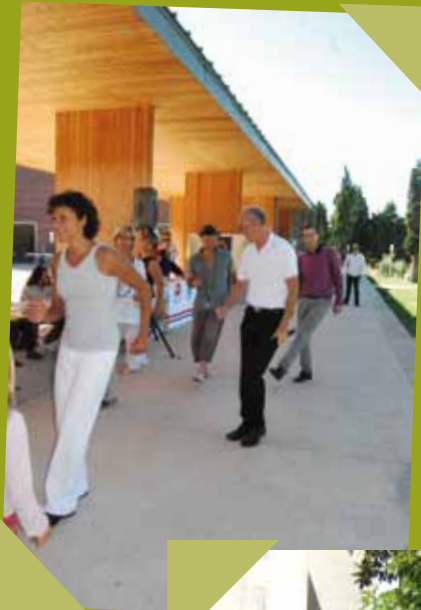
Forum des associations septembre Mausane danse