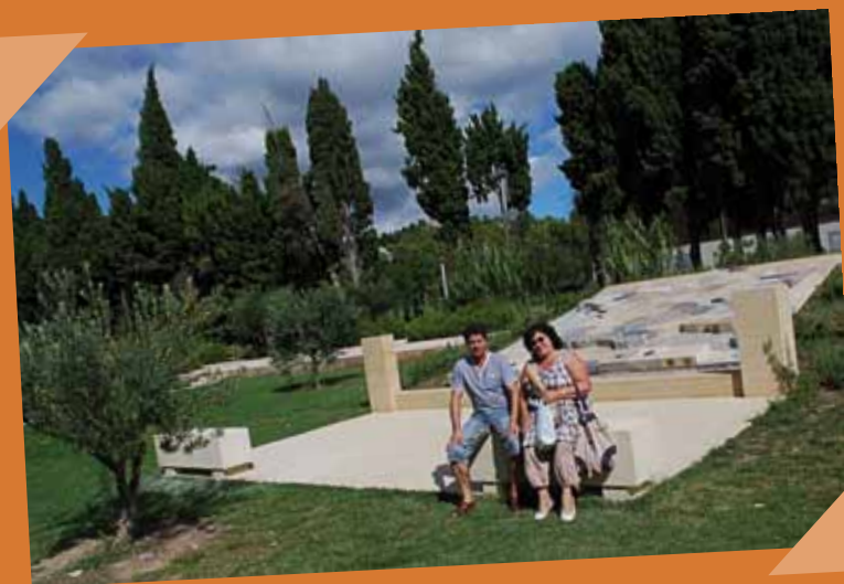
Désormais deux bancs accueillent les visiteurs devant la carte de France