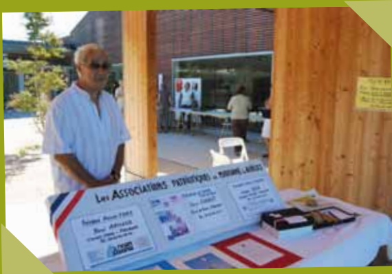
Forum des associations - septembre Associations patriotiques