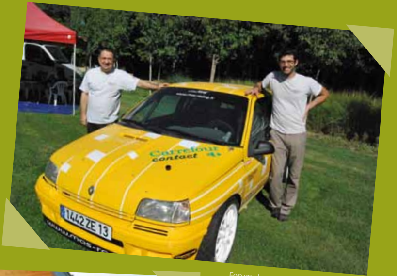
Forum des associations - septembre Alpilles Rallye Passion