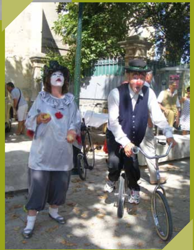
Forum des associations - septembre spectacle pour enfants