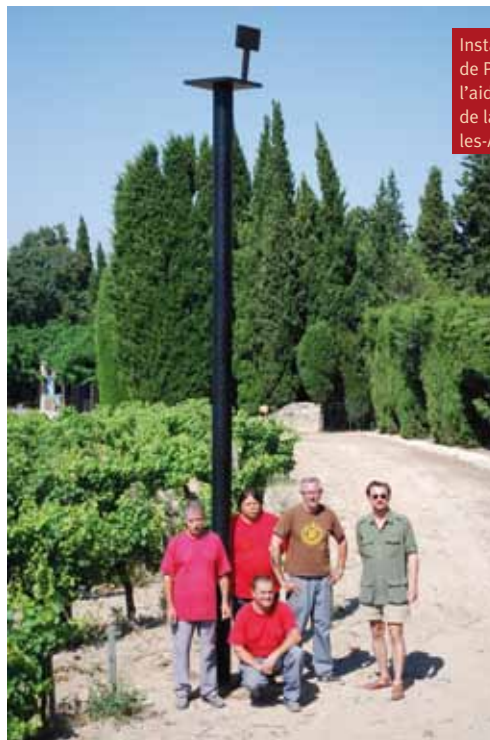
Installation de la création de Philippe Ramette avec l'aide du service technique de la mairie de Maussane-les-Alpilles.

Vous en découvrirez les conditions dans le supplément détachable du bulletin municipal consacré à la programmation de la notre saison culturelle 2010/2011