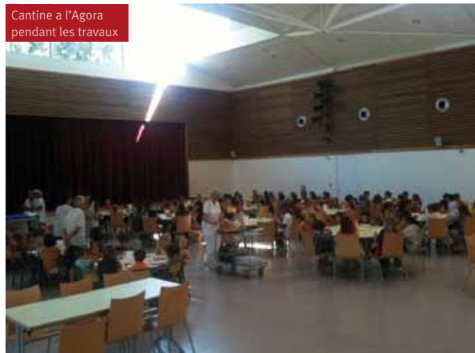
Cantine à l'Agora pendant les travaux