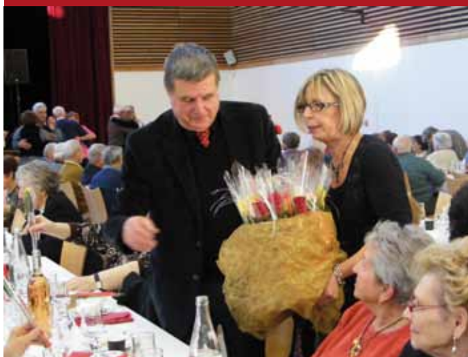
Repas des seniors

Nous leur souhaitons à toutes et tous d'agréables fêtes de fin d'année.