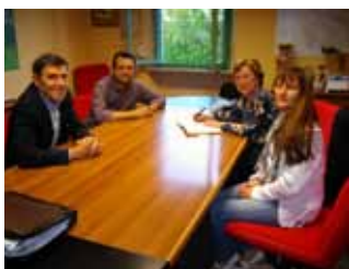
Rencontre avec les représentants de la mairie de Montopoli en mars 2011

Le comité de jumelage de Maussane-les-Alpilles avec Montopoli in Val d'Arno poursuit ses activités et bourdonne comme une ruche avec plusieurs projets à l'étude pour la prochaine année civile ; sont déjà sur les rails une conférence sur les îles de la Méditerranée (prévue en