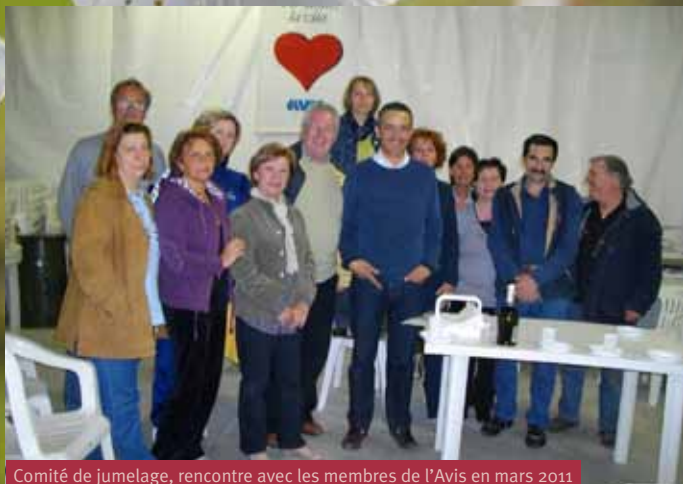
Comité de jumelage, rencontre avec les membres de l'Avis en mars 2011