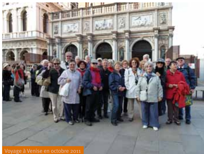
Voyage à Venise en octobre 2011

d'été, un repas italien nous a permis de nous retrouver au mois de septembre.