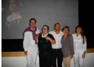
Soirée autour de La Traviata en juillet 2011