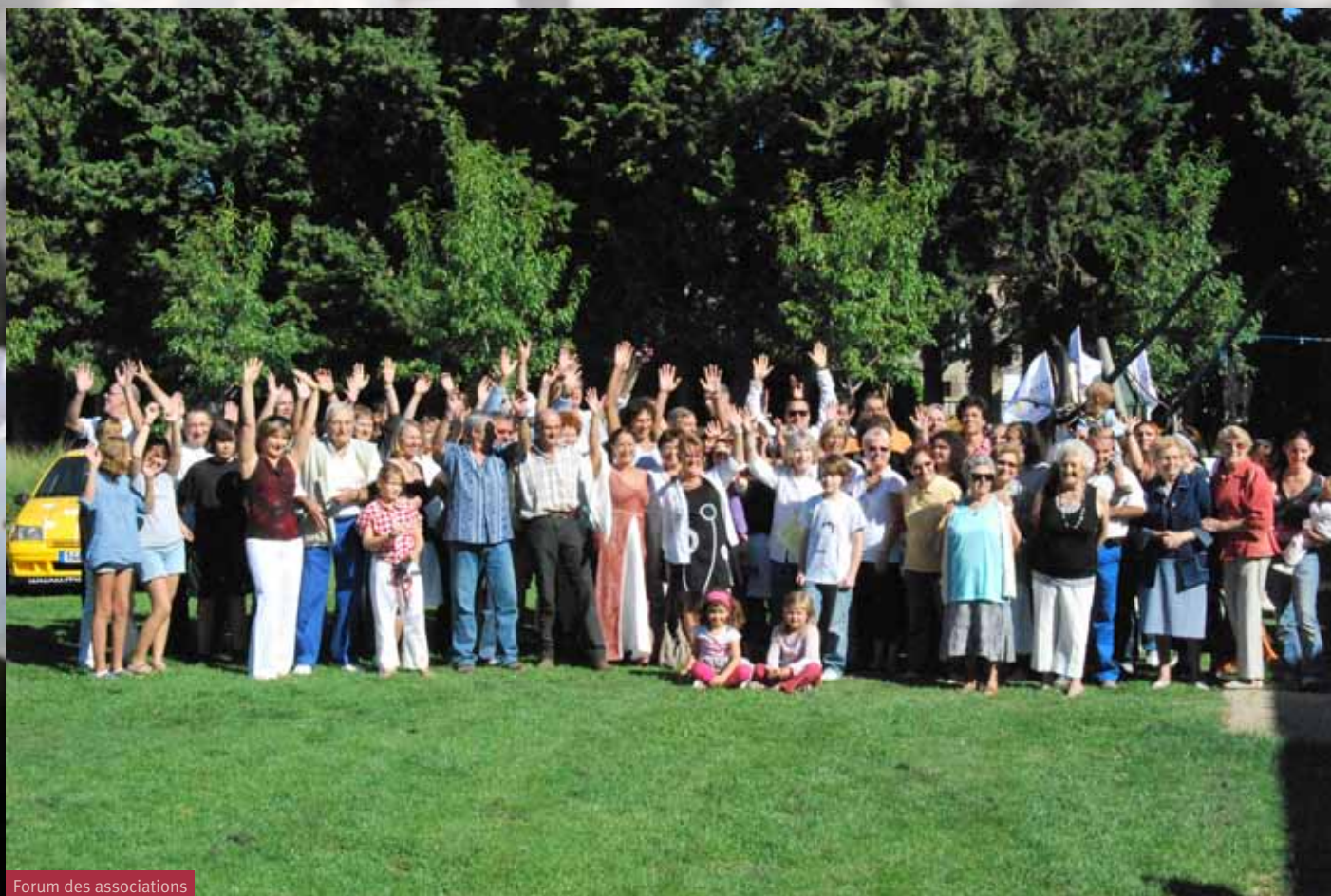
Forum des associations