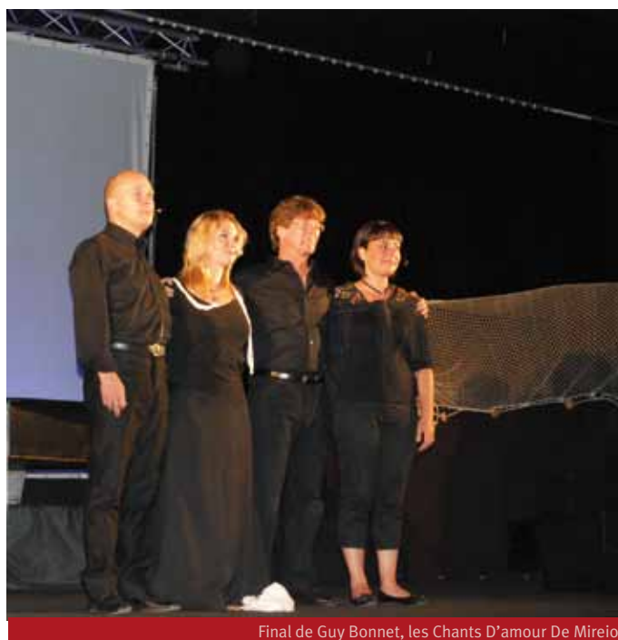
Final de Guy Bonnet, les Chants D'amour De Mireio