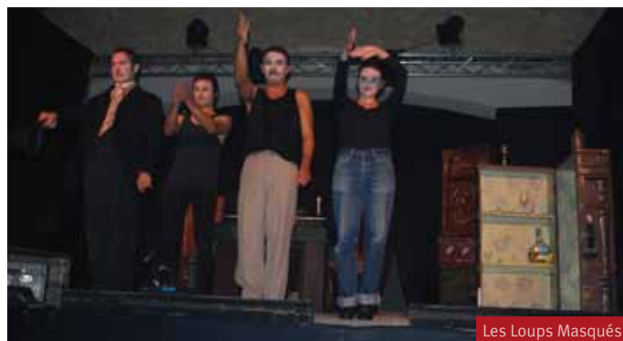
Les Loups Masqués