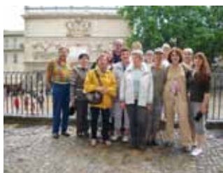
Sortie à Avignon en mai 2011

Nous n'avons pas oublié cet été ceux qui ne sont pas partis en vacances en leur proposant une soirée autour du thème de La Traviata de Giuseppe Verdi et pour reprendre contact avec tous nos adhérents, après les mois