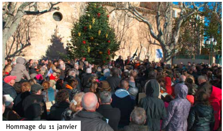
Hommage du 11 janvier