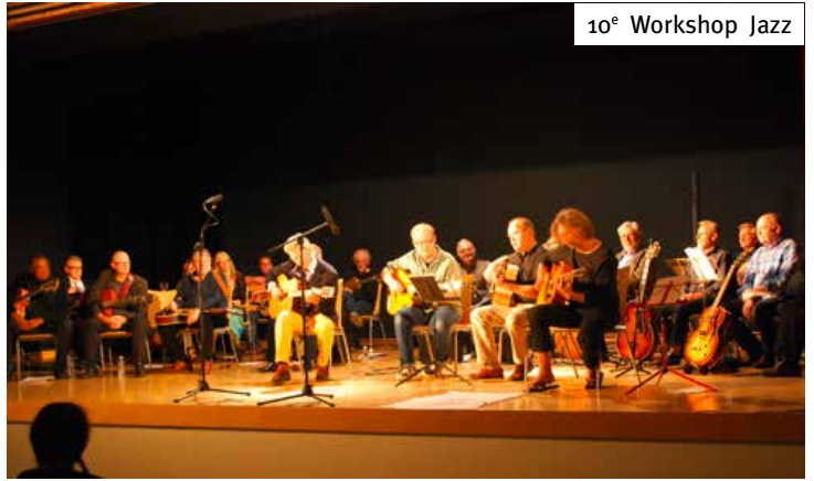
10 e Workshop Jazz