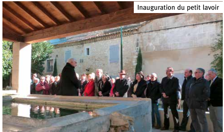
Inauguration du petit lavoir