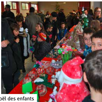
Marché de Noël des enfants