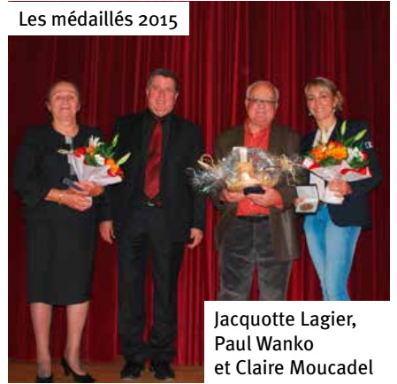
Les médaillés 2015