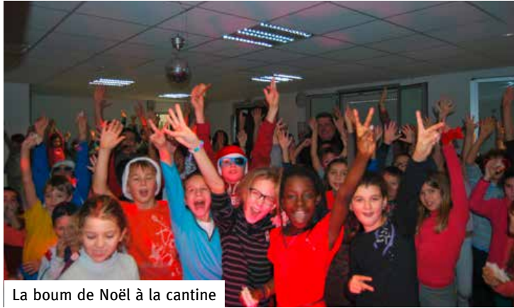
La boum de Noël à la cantine