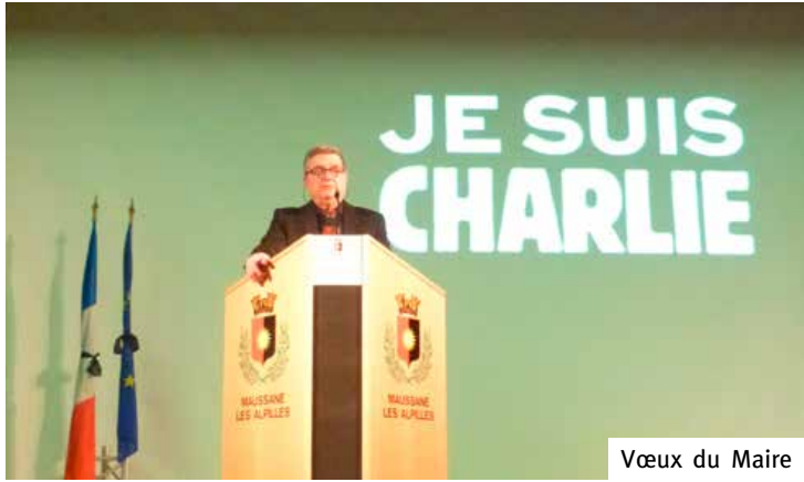
Vœux du Maire