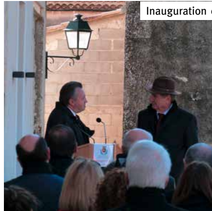
Inauguration de la Médiathèque