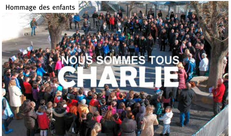
Hommage des enfants