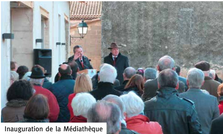
Inauguration de la Médiathèque