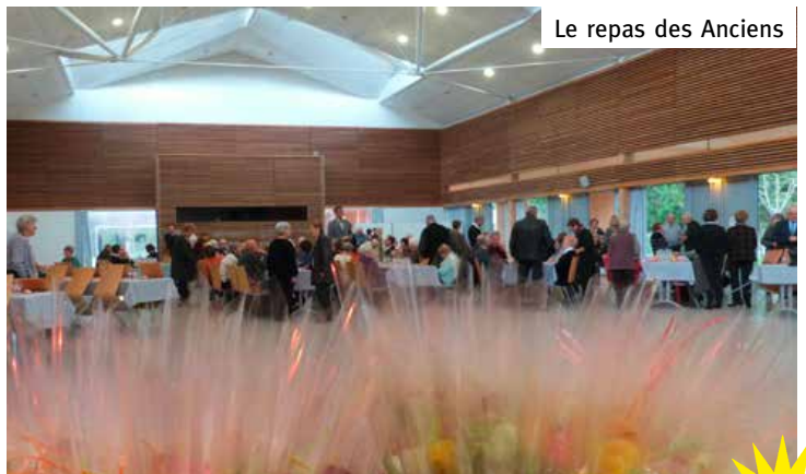
Le repas des Anciens