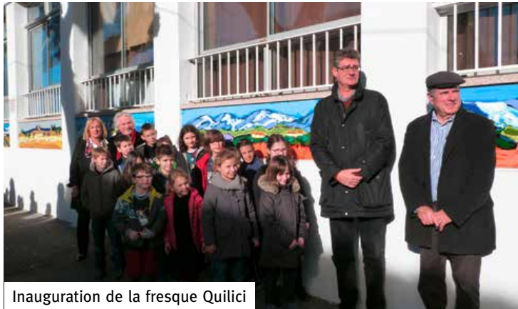
Inauguration de la fresque Quilici