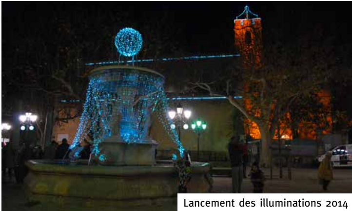
Lancement des illuminations 2014