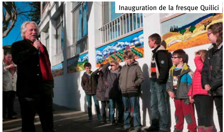
Inauguration de la fresque Quilici